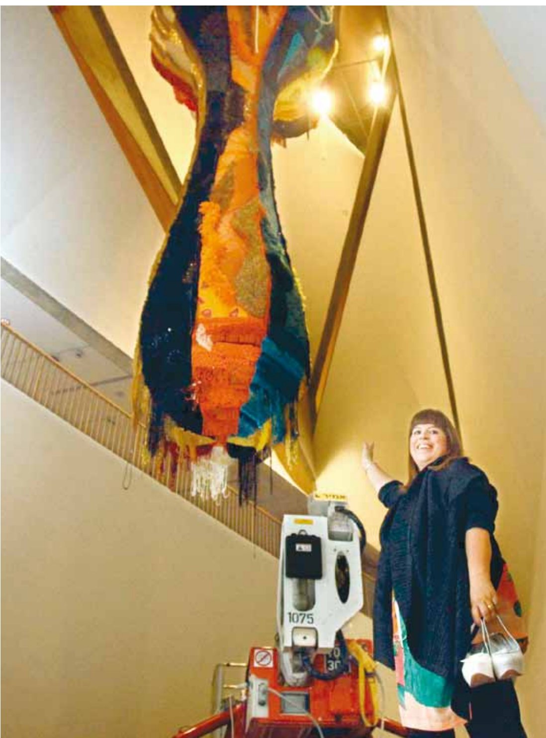
ושקונסלוש במוזיאון ת"א על רקע עבודתה החדשה

ההתחרויות הנמרצת של מוזיאון תל-אביב לאמנות בהולט