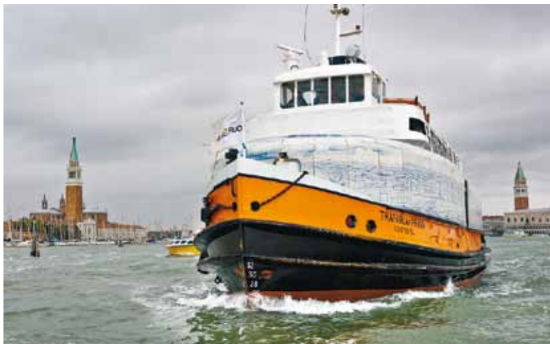
חימין: תמונת חוץ ופנים של בית פרטוגל לביאנלה בוונציה 2013. יצירה של ושקונסלוש בספינה היסטורית בעיירה. חשמאל: שנדליר טמפונים של ושקונסלוש