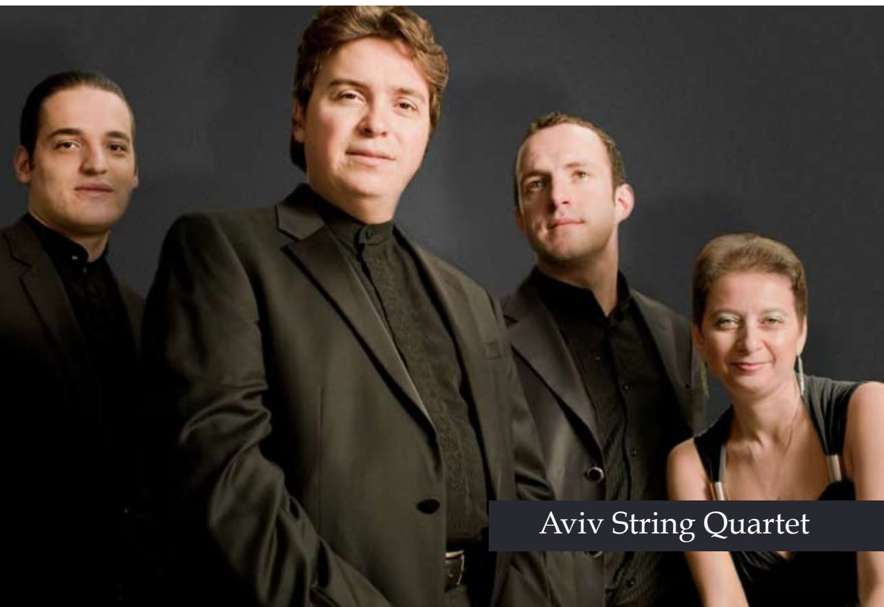
Aviv String Quartet