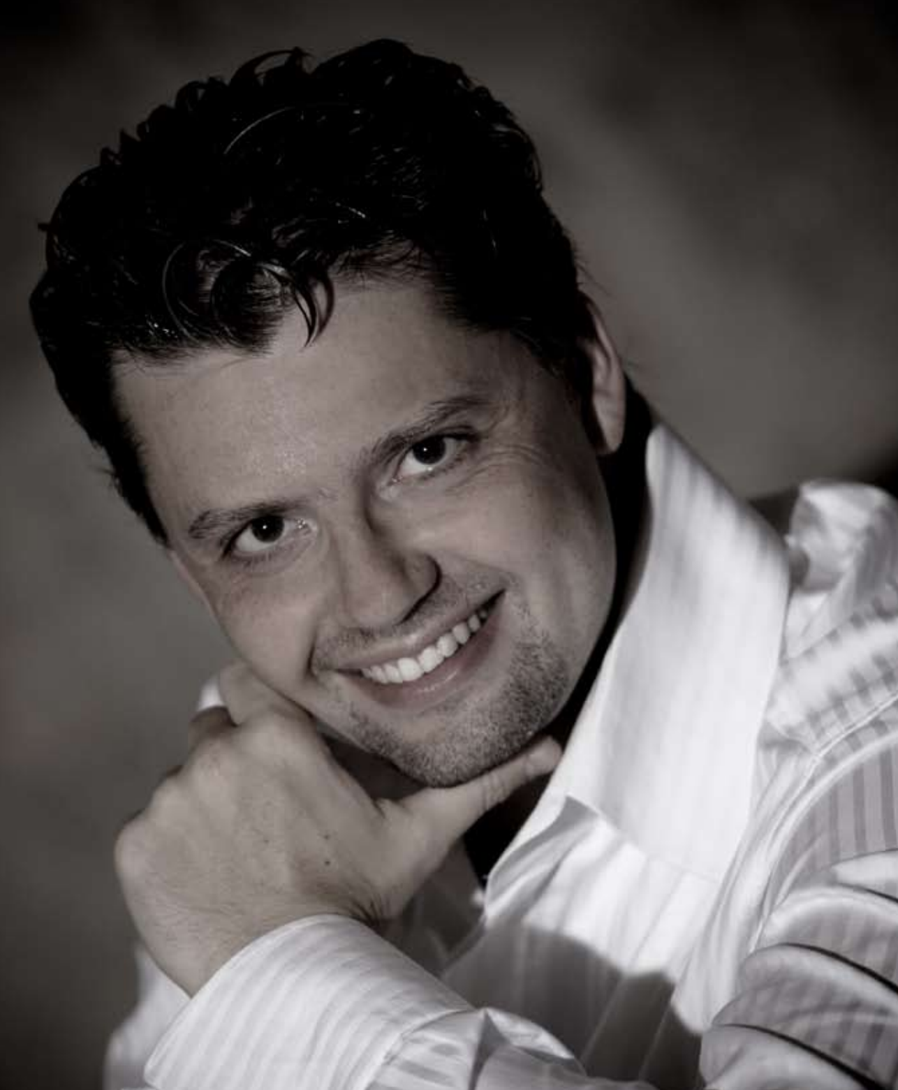
Julian Rachlin, violin