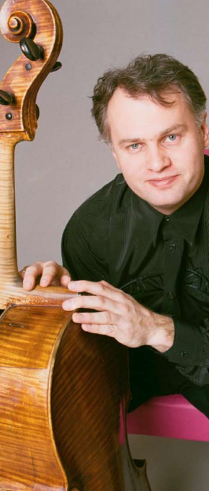
Torleif Thedeen, cello