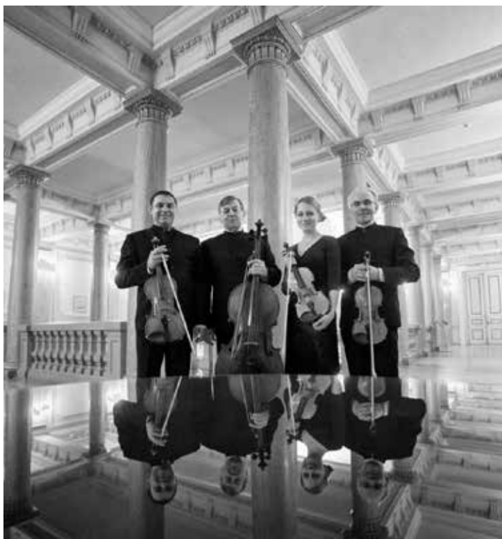
Vilnius Quartet