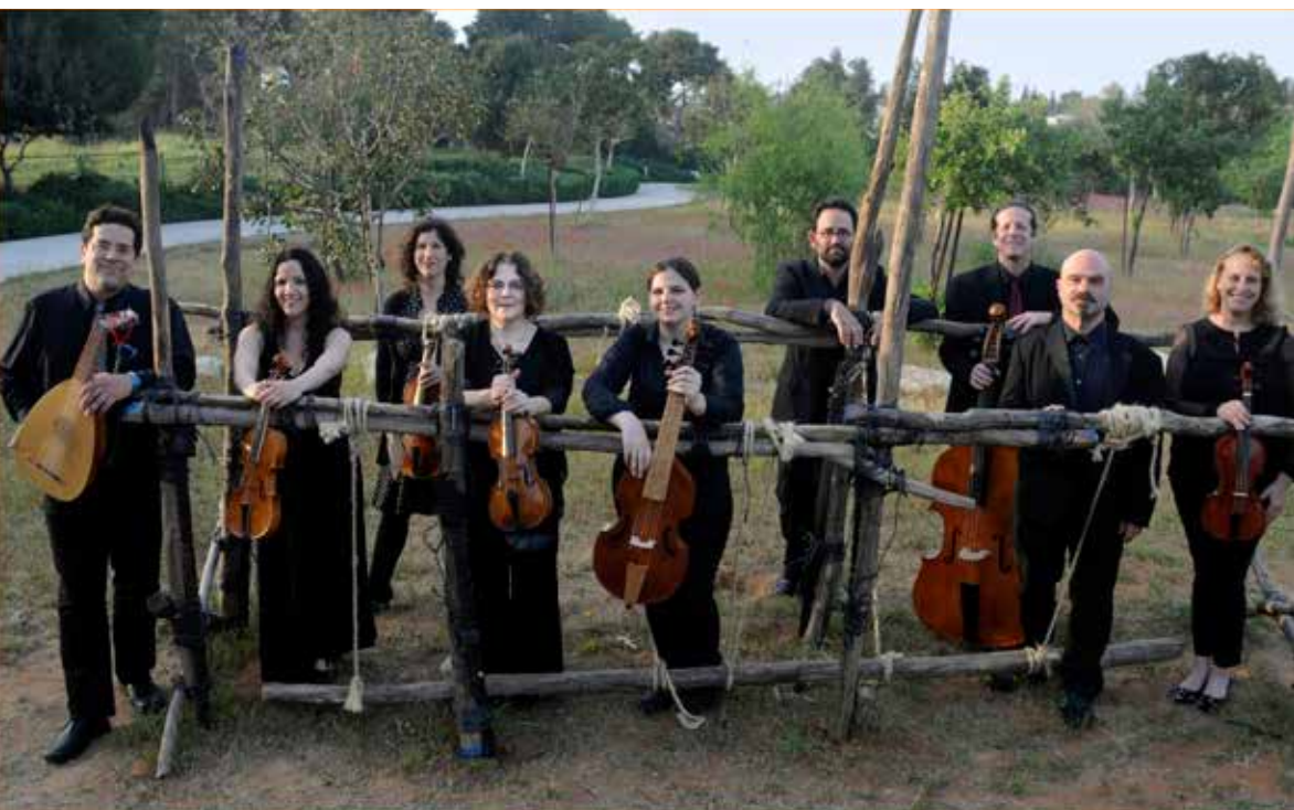
Ensemble Barrocade