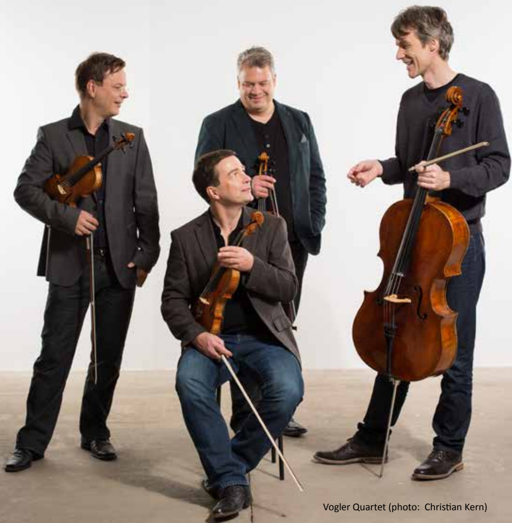
Vogler Quartet

Brahms Violin Concerto in D major Op. 77 (arr.) Soloist: Boris Brovtsyn